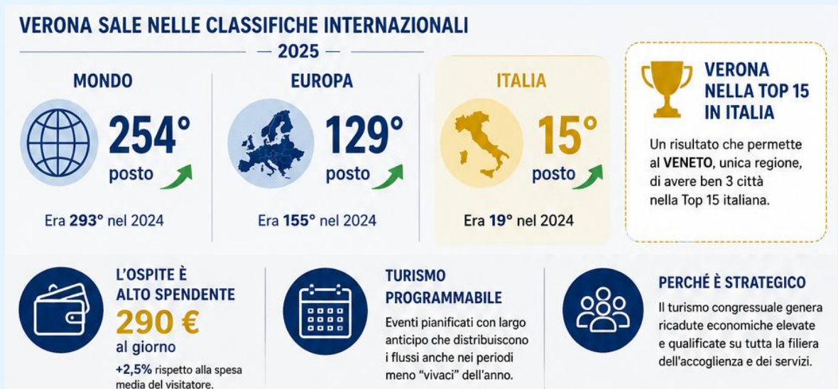
Immagine generata con IA

Verona cresce nel turismo congressuale internazionale: nel 2025 ha ospitato 10 congressi riconosciuti dall'International Congress and Convention Association (ICCA), migliorando il proprio posizionamento nelle classifiche mondiali, europee e italiane. Un risultato che conferma l'attrattività della città per eventi di rilievo internazionale.